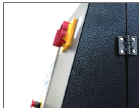
DESIGN FÖR ENKELT TILLGÅNG

Försträcknings aggregat; Försträcknings aggregat med automatisk avskärning och förslutning av filmen; Roping system; Fotocell för mörka laster; Toppres; Säkerhetsstaket; 3000 mm max pallhöjd; 2000 kg max pallvikt; Vågsystem; Lastplatta upp till \varnothing 3000 mm; Mottagare för infraröd / radiofjärrkontroll.